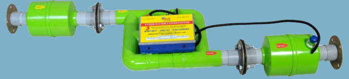
Useful For Agriculture