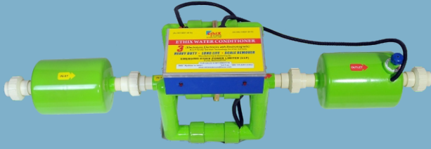
Useful For Domestic

“ट्यूब वेल, बोरिंग, हेन्ड पम्प, कुएँ के दूषित एवं खारे पानी को करो अलविदा”